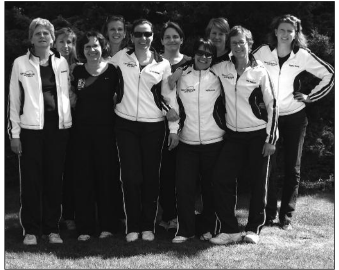
1. Damen 40