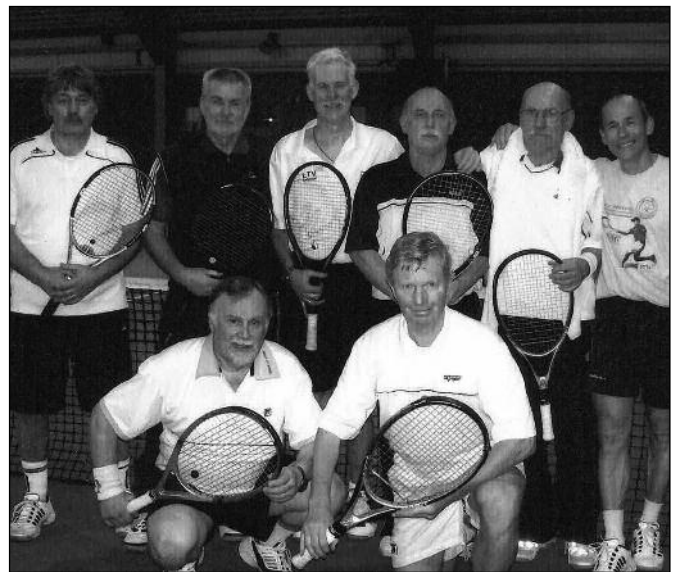
1. Herren 55